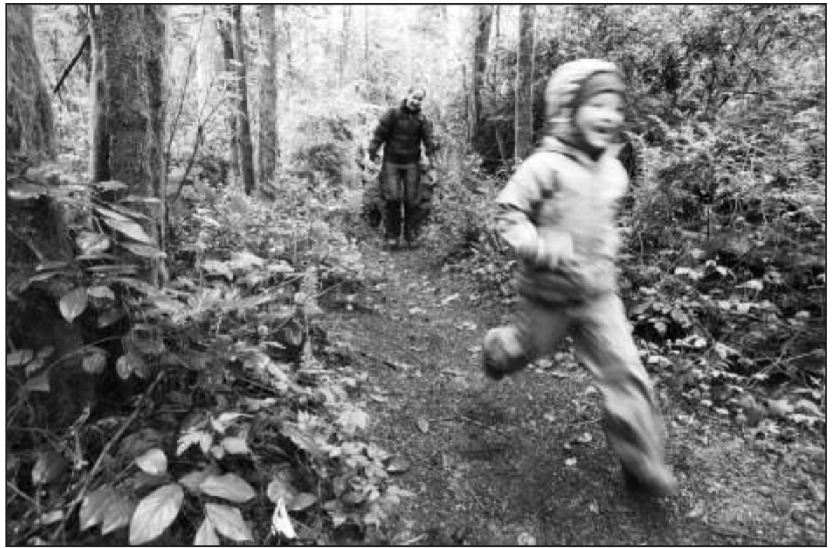
Pour Michel Maxime Egger, l'éducation devrait être fondée sur l'expérience du milieu naturel, «pour que les enfants renouent avec la pluralité du vivant et éprouvent les interdépendances existantes».

Cet été, Le Courrier consacre une série au village Alternatiba. Cette initiative transnationale tente de construire «par le bas» un réseau d'actions locales pour le climat. Chaque semaine, votre journal s'intéressera à l'une des thématiques portées par la caravane climatique et mise en branle par les acteurs locaux que vous retrouverez du 18 au 20 septembre sur la plaine de Plainpalais, à Genève: écohabitat, recyclage, alternatives numériques, éducation à l'action citoyenne, reconversion sociale et écologique de la production, et bien plus encore. Toutes ces approches sont envisagées comme des alternatives tangibles au changement climatique et à la crise énergétique. co